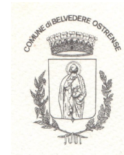
Comune di Belvedere Ostrense