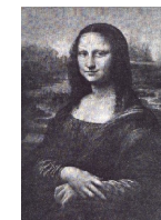
Circolo culturale "La Gioconda" Ostra