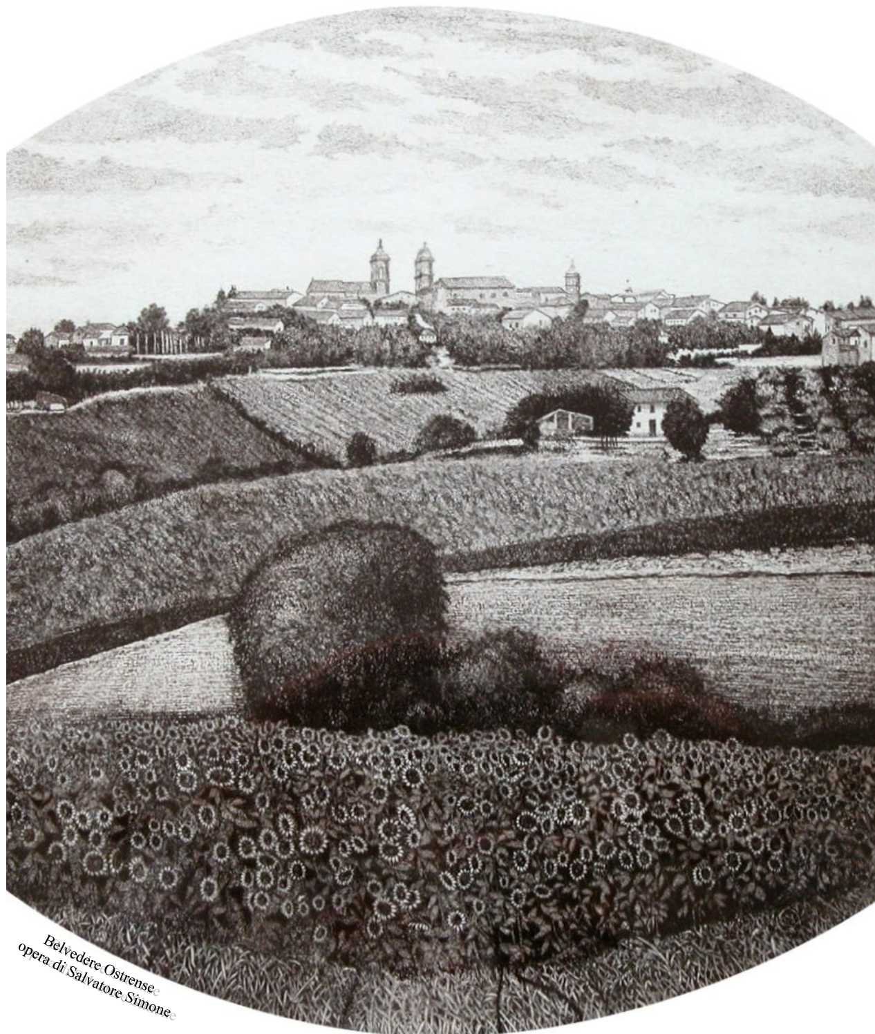
Belvedere Ostrense opera di Salvatore Simone